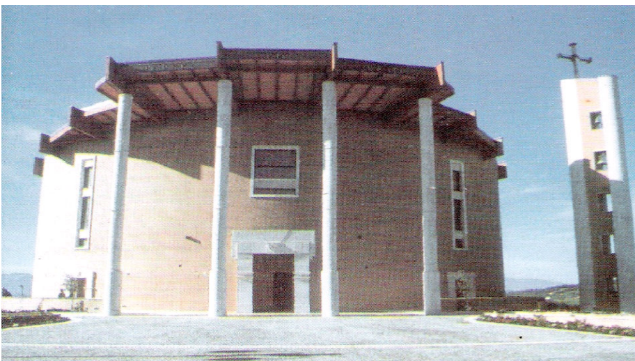
La Chiesa provvisoria di Piana Romana dove il 1° luglio canterà il Coro Polifonico "Salvo D'Acquisto"

I suoi genitori, come la gran parte dei compaesani, lavoravano la terra, curavano gli animali, respiravano quel mondo della campagna. In quest'ambiente rurale emergono in maniera molto forte i valori fondamentali della