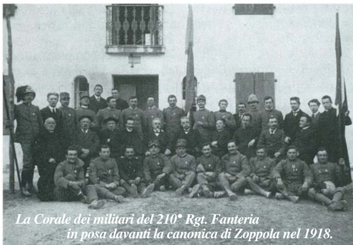
La Corale dei militari del 210° Rgt. Fanteria in posa davanti la canonica di Zoppola nel 1918.