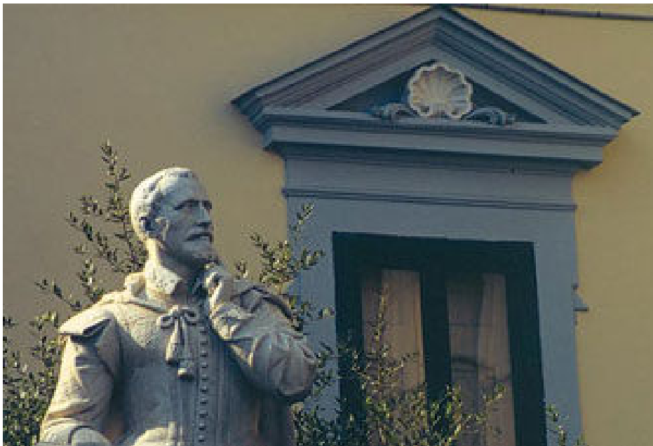
Torquato Tasso, illustre cittadino sorrentino, cui è dedicata la piazza principale della bellissima località, in cui si svolgerà il prossimo 27 maggio il nostro concerto