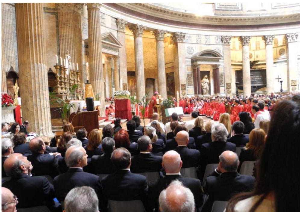
ROMA - Il Coro al Pantheon per la Messa "dei petali", lo scorso 19 maggio 2013.

C'è davvero lavoro per tutti, Maestri e Coristi!