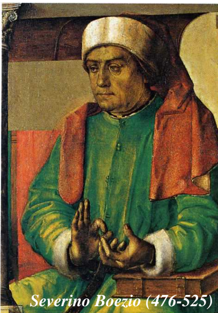
Severino Boezio (476-525)